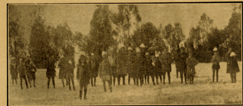
'n Klompie van die skoolkinders op Clarens na 'n onlangse kapokstorm.

gegaan. 'n Ou Kaffer het vir my eiers gegee, toe sit ek die eiers onder 'n hen, en al ag het uitgekom. Nou is hulle omtrent drie dae oud. Hulle is maar net so groot soos 'n gewone kuiken, en hulle is nou net in hulle skik met die hen-ma. Ek sorg baie goed vir hulle. Die haantjie het 'n horing op sy kop en eet net mielies en koring. Vir ons is hulle bang, want as ons in die hok ingaan, hardloop hulle in hul slaaphuisie in; dan bly die hen alleen buitelikant, en as ons 'n tydjie uit is, dan kom hulle eers uit.