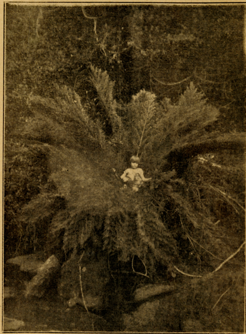
Baba Steyn in 'n reusagtige pambos.

Die Spartane het hulle so te sê net op oorlogskuns toegelê. Hulle het dan ook alles daarvoor opgeoffer. Die