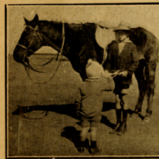
Boetie, ek wil Die Kleinspan lees.

Liewe Kleinspan. —Ek wil julle vertel van my tarentaaltjies. Ek het ag van hulle gehad, maar een het weg-