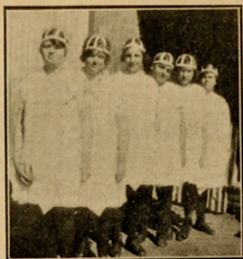
Meisies wat verversings bedien het om fondse vir hulle skoolvakansie bymekaar te maak.

Die waens was vooruit met die pro-wiant en tente. Toe ons laat in die middag daar aangekom het, het party van ons die tente opgeslaan, onder-wyl die ander hout en water gaan haal het, en ook kos gekook het. Ons het koffie gemaak en ons vleis het ons op mikstokke gebrui; na die ete het ons gaan baai; dit was al donker, maar die water was aangenaam gewees. Om nege-uur moes alles stil wees, en om halftien moes al die ligte uit gewees. Die anderdagmore het ons halfsewe opgestaan en vir 'n uur gaan marsjeer, toe het ons ontbyt geniet en gaan leer om met die vlak te signaleer en ons het verder met geweroefening tot die middagete aangehou. Na 'n goeie ete het ons gerus en van vyf- tot ses-uur weer oefeninge gedoen. Ek is sersjant en het help kos uitdeel. Ons, jongseuns, was plesierig en het die lewe baie geniet. In die aand het ons weer gaan baai en toe ons teruggekom het, het die Kaptein die wagte op die vier hoeke van die kamp uitgesit. Elke wag het 'n uur gestaan, en ook twee prisoniers gevang, wat na ons kamp wou geslaap. Die anderdag het ons ontbyt gemaak, en die tente begin afslaan. Toe het ons Vekop-toe gemarsjeer waar eerwaarde Brown 'n kort Engelse diens gehou het, en na die diens is ons terugkamp-toe vir ons middagete, bestaande uit vleis, aartappels, brood en kof-